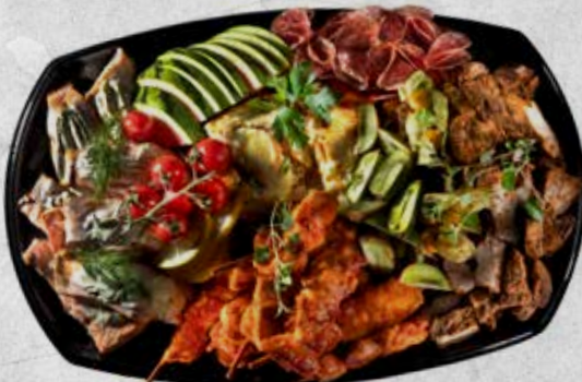
Dekor av frukter (jordgubbar, ananas, passionsfrukt, druvor, physalis)

Minsta antal är 6 personer vid beställning