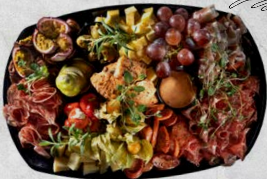
Dekor av frukter (jordgubbar, ananas, passionsfrukt, druvor, physalis)

Minsta antal är 6 personer vid beställning