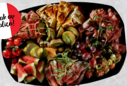
Dekor av frukter (jordgubbar, ananas, passionsfrukt, druvor, physalis)

Minsta antal är 6 personer vid beställning