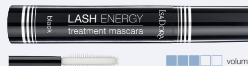
Lash Energy Treatment Mascara black En cell-stimulerande och stärkande mascara som också ger dina fransar volym och lyster.