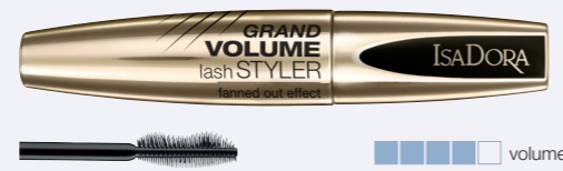
Grand Volume Lash Styler Volymmascara som ger både längd och separation.