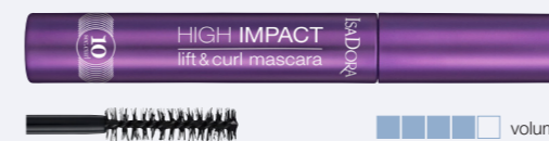
10 Sec High Impact Lift & Curl Mascara En mascara som ger volym, ett omedelbart lyft och vackert böjda fransar.