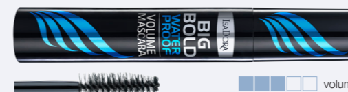
Big Bold Waterproof Volume Mascara En krämig vattenfast volymmascara.