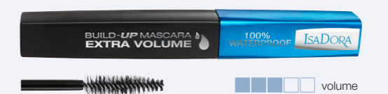
Build-Up Mascara Extra Volume 100 % vattenfast mascara som bygger volym.