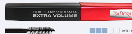
Build-Up Mascara Extra Volume En byggbar volymmascara som sitter extra länge.