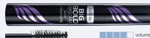
Big Bold Mascara En intensiv volymmascara för dramatiskt tjockare, längre fransar.