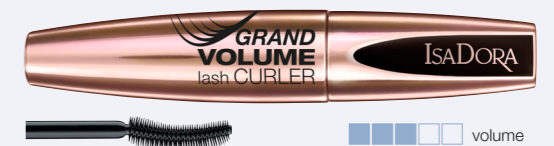
Grand Volume Lash Curler En mascara som sitter extra länge och som ger fransarna en extra push-up effekt.