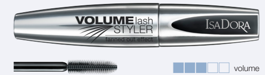
Volume Lash Styler Volymmascara som skapar en effekt av definierade och separerade fransar.