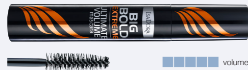
Big Bold Extreme Mascara En extrem volymmascara med lösögonfransseffekt.