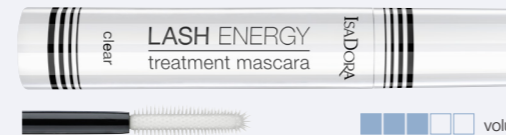
Lash Energy Treatment Mascara clear En cell-stimulerande och stärkande mascara som också ger dina fransar volym och lyster. Boosta fransarna genom att använda den transparenta formulan som en overnight-behandling.